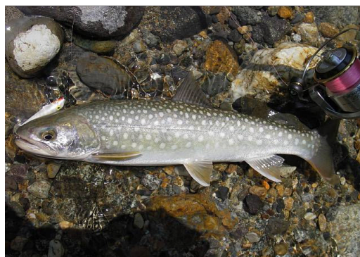
いわな(今日放流)(やまめより上流にいます)